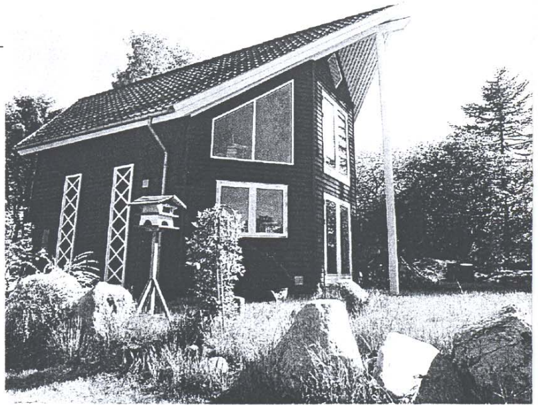
▲ Det ottekantede hus er meget karakteristisk med det spidse vikingskibsformede tag.

Husets eneste kulørte rum er det solgule badeværelse med dør til det fri og god plads til at stryge tøj og smukkesere sig.